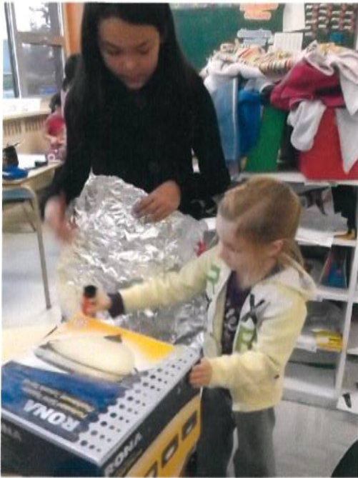
On colle les décorations