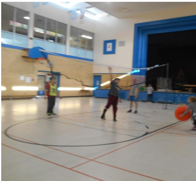
Une pratique de volley-ball