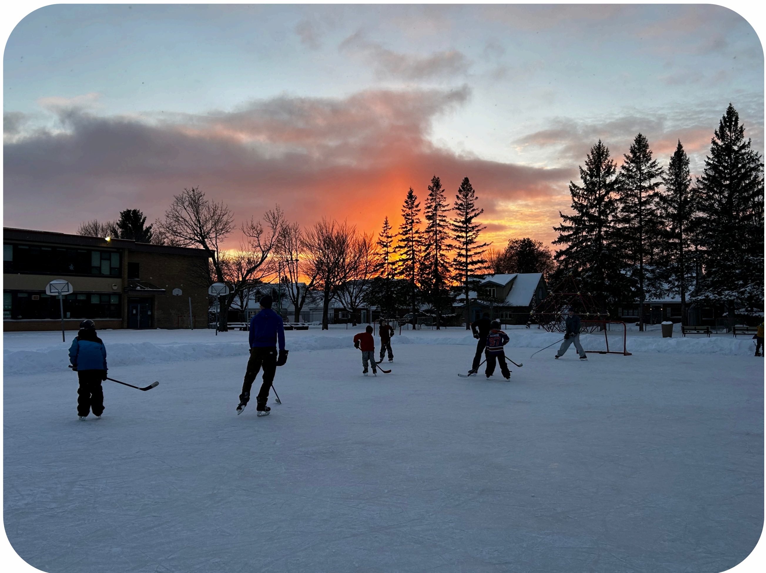
Le soir du 25 décembre